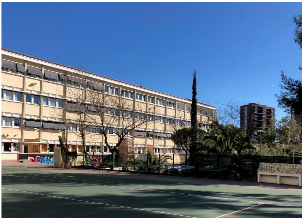
Vue sur les façades du bâtiment principal