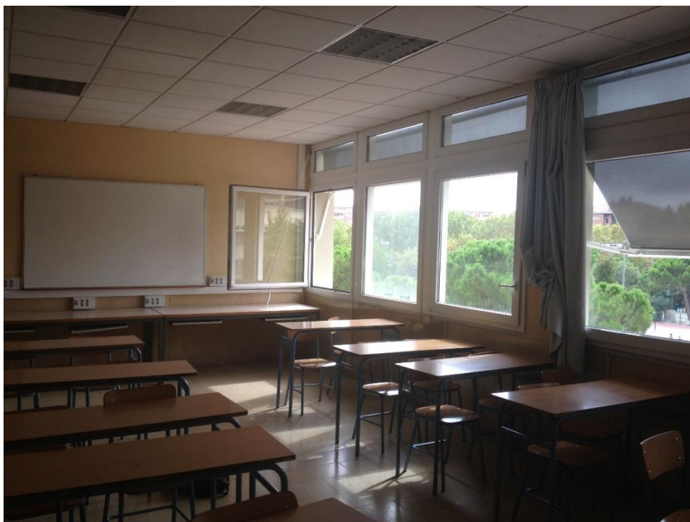
Intérieur salle de classe