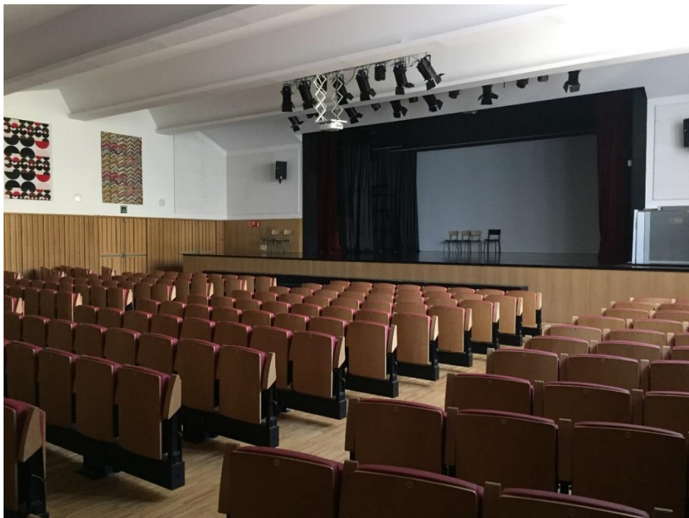
Vue intérieur auditorium